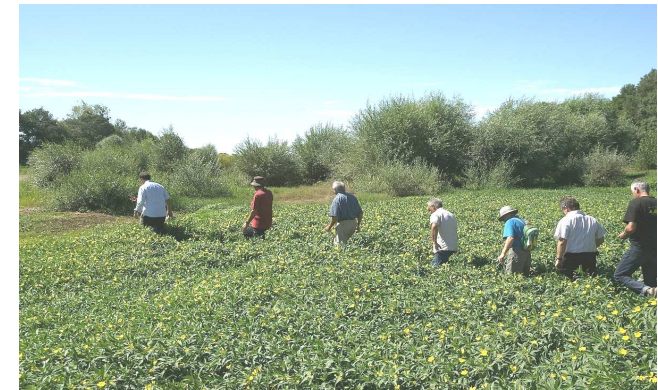
Passage des observateurs dans le lit du bras d'Anetz colonisé par la jussie et les saules, illustrant la rapidité de l'évolution et l'ampleur du déséquilibre...

Il propose une réunion de travail sur ce sujet au Conseil Régional dans le courant du mois d'octobre.